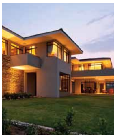
Private huis gebou op eiendom